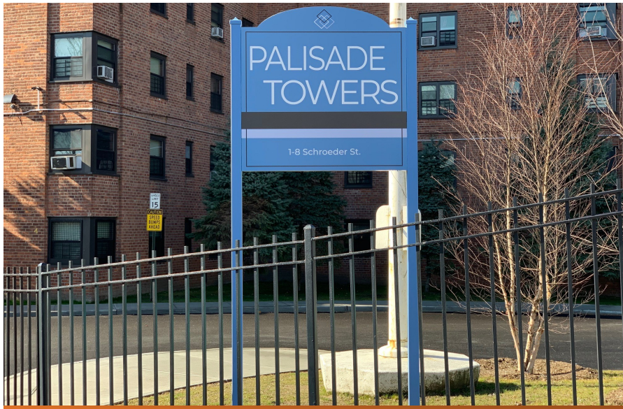
Palisade Towers Newsletter May 2020 Spring/ Summer Edition 1st Quarter