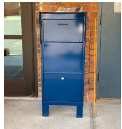
Blue mailbox in front of building 8