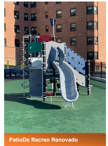
PatioDe Recreo Renovado

Fechas De Planificacion Marzo 12 – Julio 31 Fechas De Revision Marzo12 – Octubre 31